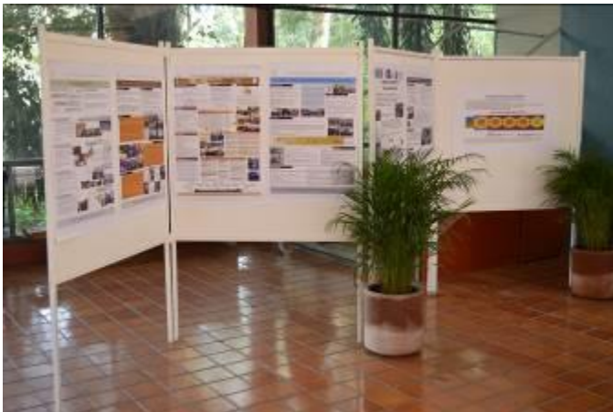
Exposición de posters