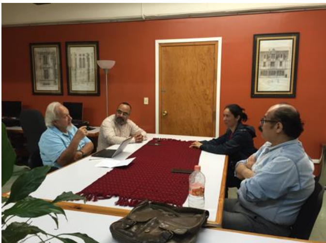
Reunión de trabajo con profesores del UVCA 405 Cultura del Hábitat. Xalapa, Veracruz. 2017.

Federal Mexicana, tales como "El Derecho a la Ciudad", "Equidad e Inclusión". Es de considerarse que el primer aspecto abarca a muchos otros conceptos, por este motivo se hace una reflexión desde un punto de vista mucho más amplio, tal como aparece en el artículo federal recientemente modificado, al incluir ideas de seguridad, sentimiento de unidad, aspectos sociales, aspectos psicológicos, aspectos ambientales y culturales; es decir en todas las dimensiones que permiten un "buen vivir" y que no solo sean decisiones de unos cuantos, evitar que se consulte a la población de forma genérica, si no por el contrario, tomar en cuenta las consideraciones de los niños, de los adolescentes, de los jóvenes, de los adultos y de los adultos