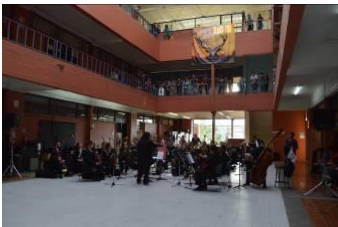
Presentación orquesta de la Universidad Veracruzana