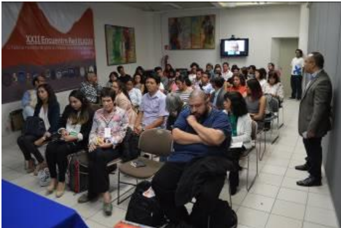
Presentación de cátedras