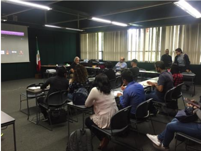
Seminario con estudiantes de grado FAUV Xalapa. Xalapa, Veracruz. 2017

arquitecto y el urbanista es "armonizador" que no busca reprimir, si no conciliar todas aquellas solicitudes de la sociedad, y que las acciones que haga un grupo, no sea pérdida para otro, por el contrario que sea una propuesta integral.