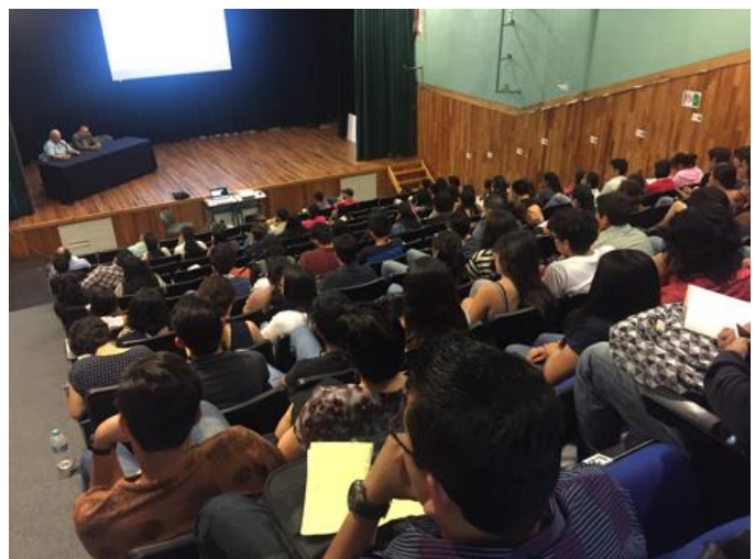
Ponencia Magistral con estudiantes de pregrado y grado FAUV Xalapa. Xalapa, Veracruz. 2017.