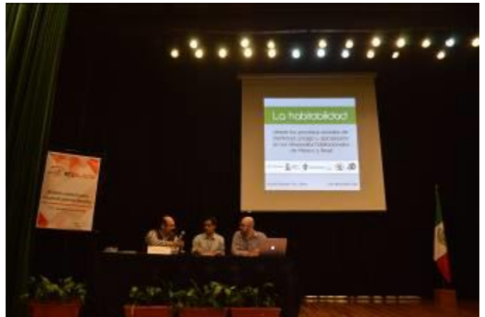
Presentaciones de cátedras participantes