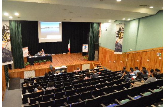
Presentaciones de cátedras participantes