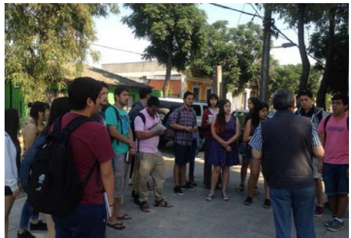
Visita Conjunto Huemul