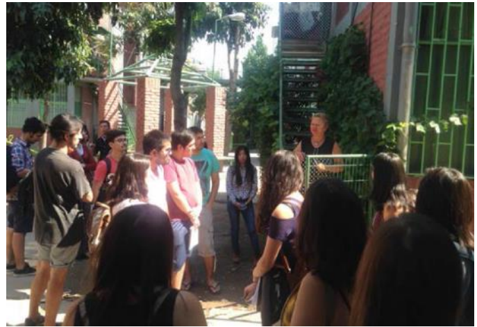
Visita Conjunto Andalucía