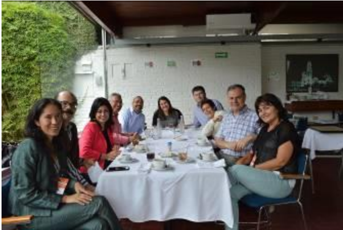
Almuerzo de bienvenida