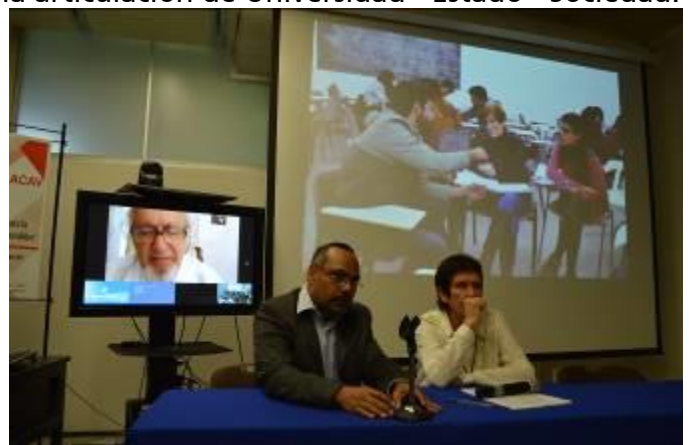
Presentaciones y videoconferencias