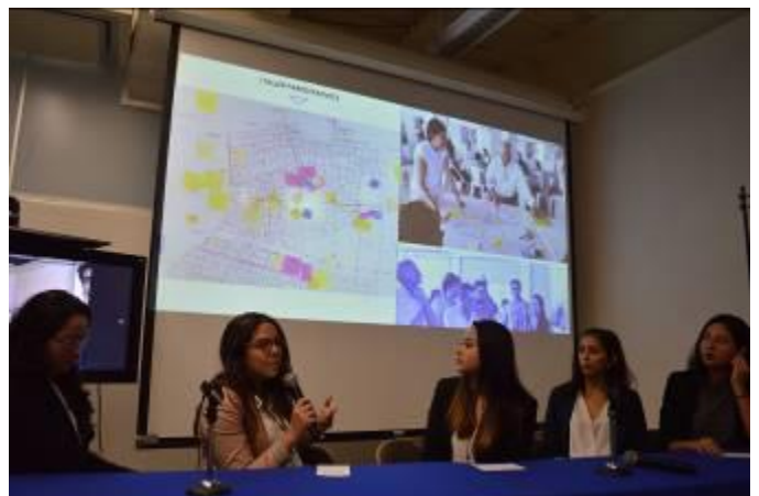
Presentaciones de cátedras participantes