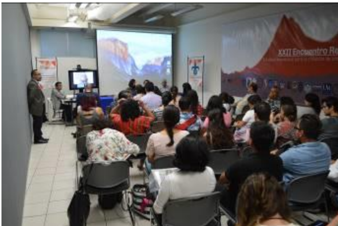
Presentación de cátedras por videoconferencias