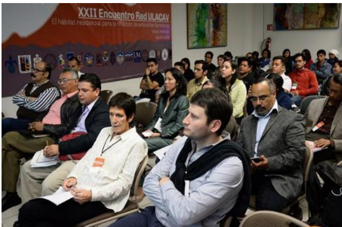
Apertura del Encuentro (arr. y aba.)