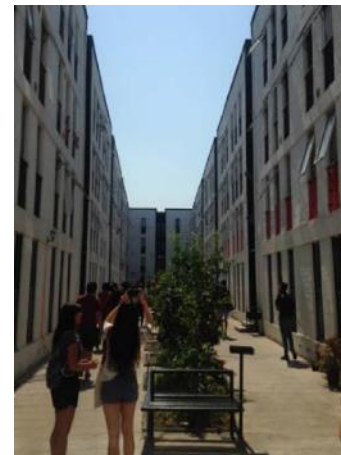
Visita Neo Cite