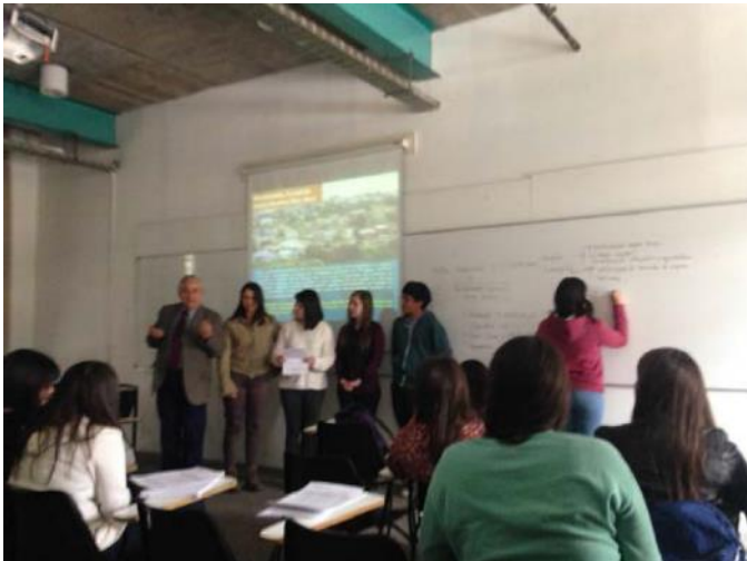
Visita de Expertos