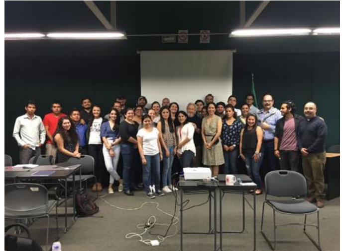
Seminario con estudiantes de grado FAUV Xalapa. Xalapa, Veracruz. 2017