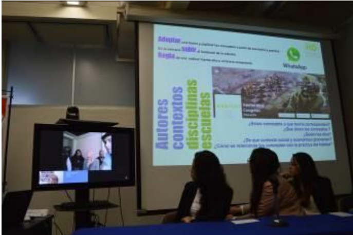
Presentación de cátedras por videoconferencias